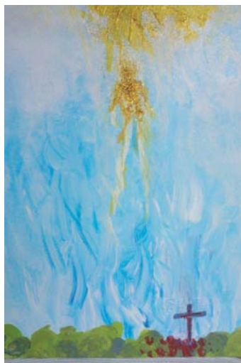
Kristi himmelfart - maleri af Panna Ildikó Friis-Grigonzca,

Så er det blevet tid til det årlige menighedsmøde for vore to sogne. Menighedsrådene vil fortælle om arbejdet ud fra kirker og præstegård. Da der i efteråret 2016 skal vælges nye menighedsråd, vil vi også denne dag se frem mod denne vigtige begivenhed. Der vil blive budt på lidt at spise og drikke. Velkommen til alle som har interesse i sogn og kirke.