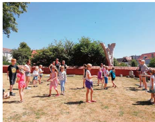
Billedet er fra seneste Sommerkirke i Skt. Nikolai i 2018.