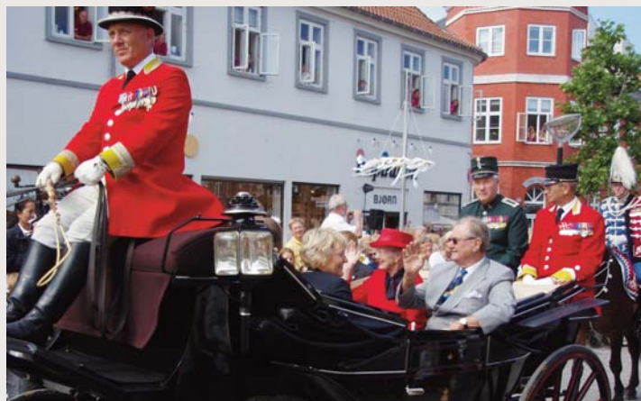
Billede fra dronningens besøg i Holbæk.

Undervejs vil han både trække tråde tilbage i tiden og give et bud på, hvad fremtiden vil bringe for monarkiet i Danmark, ligesom han løbende vil sammenligne med udviklingen i de øvrige kongehuse i Europa.