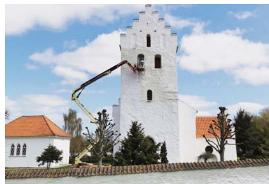
Snart er det pinse og i år vil Nr. Jernløse Kirke været nykalket til højtiden