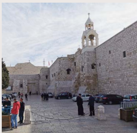
Fødselskirken i Betlehem.