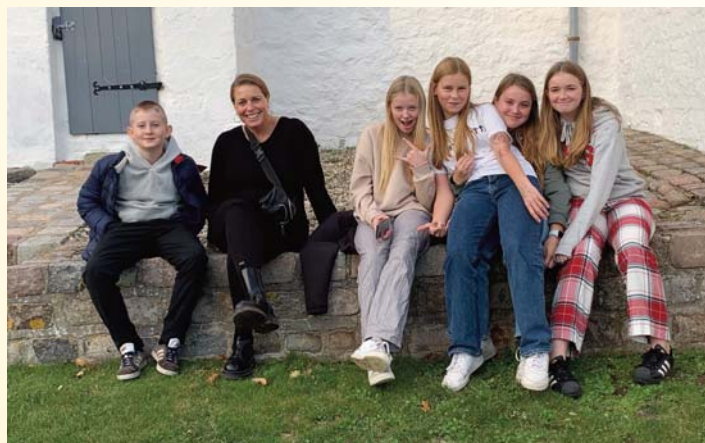
Et udpluk af konfirmanderne. Der mangler to.