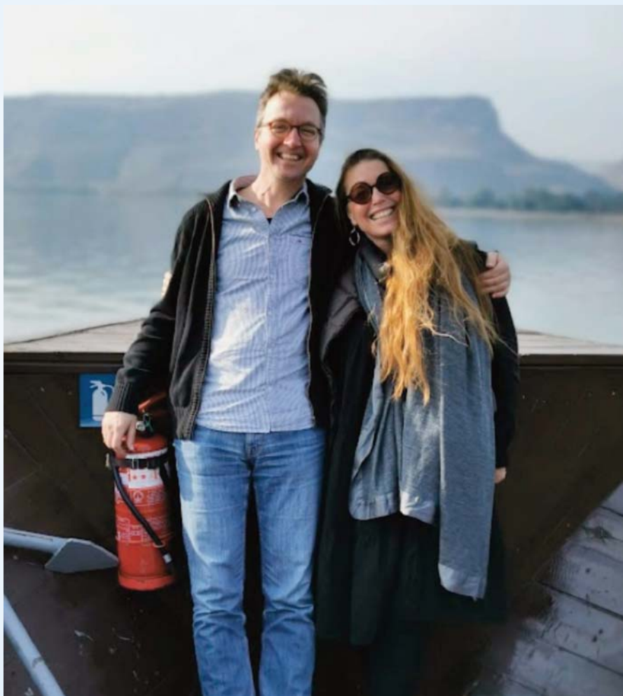
Sejltur på Genesaret sø.